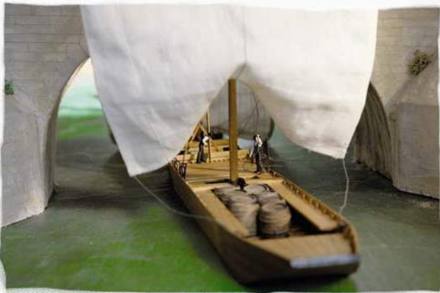
Musée des 2 Marines et du Pont-Canal

Imaginez-vous 200 ans en arrière, du temps où marinières, péniches, futreaux et marchandises transitaient de Loire en canaux pour approvisionner les plus grandes villes du pays. Entre maquettes et scénographies, on revit ici l'épopée humaine et technique du plus grand carrefour batelier de France.