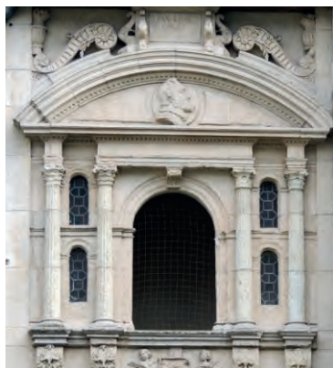
Maison-Henri IV © Mairie d'Orléans

Faites confiance au guide, il vous parlera d'un sujet inédit... seulement voilà... c'est à vous de le découvrir ! Suivez ses pas, en véritable fil conducteur, il vous aidera à percer le mystère de cette visite. Une chose est certaine, nous vous parlerons du 16 ème siècle ! Une récompense sera attribuée au visiteur qui trouvera la bonne réponse !