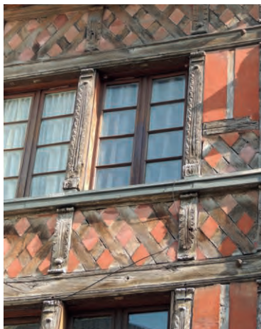
Maison rue Sainte-Catherine

Cette visite vous emmènera à la découverte du 16 ème siècle à Orléans, à la lumière de grands événements. La Renaissance a laissé à la Ville de nombreux témoignages de son architecture de pans de bois ou de pierre. Sur les façades donnant sur les rues ou cachées dans les cours intérieures, fleurissent les décors luxuriants et raffinés de cette époque, largement inspirés de l'Antiquité.