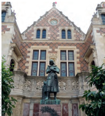
Hôtel Groslot

Monument emblématique d'Orléans, cet hôtel particulier du 16 ème siècle a vu passer dans ses murs de nombreux personnages illustres. Il présente un plan et une architecture Renaissance qui seraient attribués à JACQUES ANDROUET DUCERCEAU. Au 19 ème siècle, le bâtiment devenu Hôtel de ville est agrandi et doté d'un riche décor Néo-Renaissance représentatif de l'engouement de l'époque pour le 16 ème siècle.