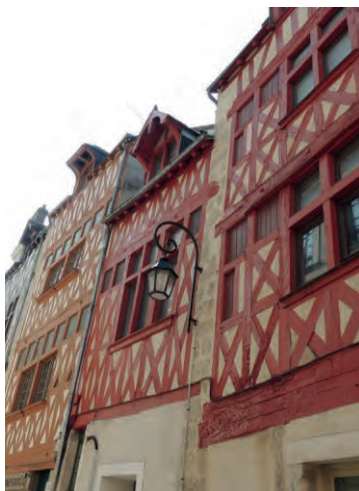
Rue de l'Empereur, façades du 16 ème siècle

Malgré les importantes destructions liées aux travaux d'urbanisme des 19 ème et 20 ème siècles et à l'incendie de 1940, l'étude de l'évolution architecturale de l'habitat domestique à Orléans est facilitée par la conservation d'un riche corpus de maisons élevées à la fin du Moyen Âge et au début de l'époque Moderne. Désormais mieux connue pour son architecture à pan de bois, Orléans, foyer humaniste de la seconde Renaissance, se distingue également par la qualité de sa construction en pierre et/ou en brique. L'objectif est de présenter plusieurs catégories d'édifices, de la maison polyvalente héritée des siècles précédents aux grandes demeures constituant les premiers exemples d'hôtels particuliers de la ville, souvent à l'initiative de riches bourgeois ou de grands personnages.