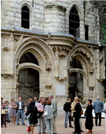
Jardin de l'Hôtel Focault

Les plus prestigieuses demeures Renaissance d'Orléans n'auront plus de secret pour vous grâce aux explications de nos guides costumés !