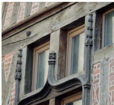
Maison rue du Vaudour

Sous forme de jeu, cette visite vous entrainera à Orléans au 16 ème siècle. Visite ouverte aux enfants de 6 à 12 ans accompagnés d'au moins un adulte.