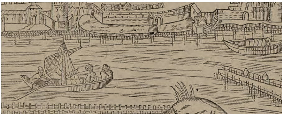
Bateaux naviguant sur la Loire, 16 ème siècle