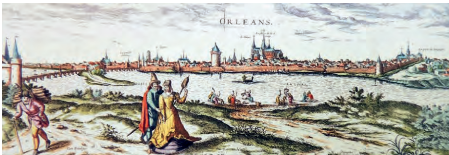
Orléans, 16 ème siècle, estampe

Médiathèque - Place Gambetta, Orléans. Gratuit.