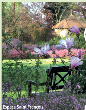
Espace Saint François