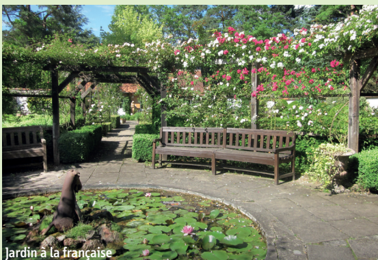
Jardin à la française