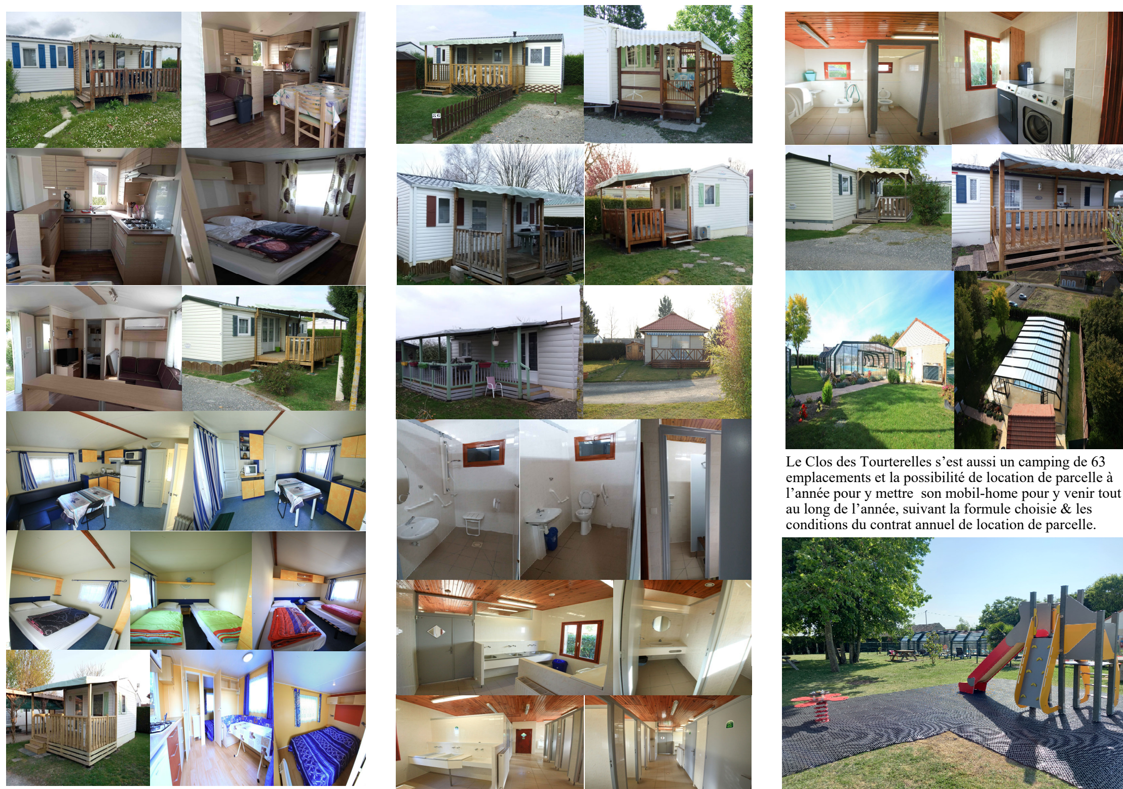
Le Clos des Tourterelles s'est aussi un camping de 63 emplacements et la possibilité de location de parcelle à l'année pour y mettre son mobil-home pour y venir tout au long de l'année, suivant la formule choisie & les conditions du contrat annuel de location de parcelle.