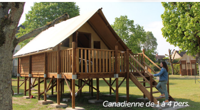
Canadienne de 1 à 4 pers.