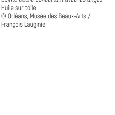
école bolonaise Sainte Cécile concertant avec les anges Huile sur toile