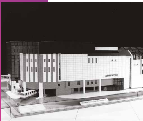
▲ Maquette du Muséum d'Orléans. Vers 1987-1990. Photographie.