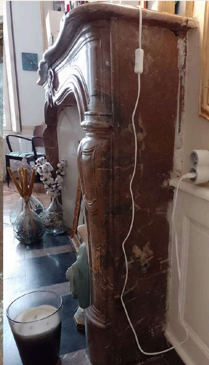
Etat du support avant intervention Salon