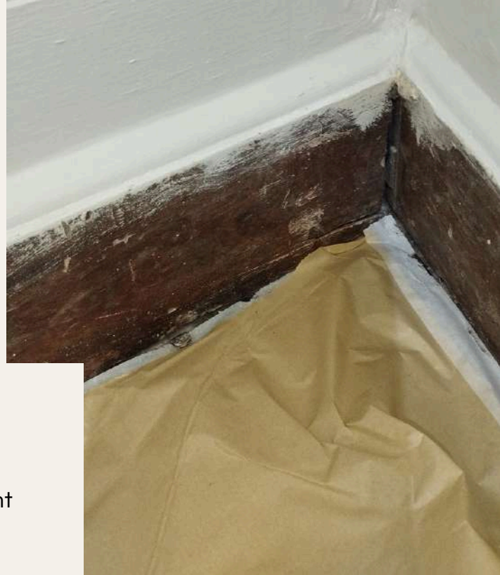
Plinthes du salon - aperçu avant restauration