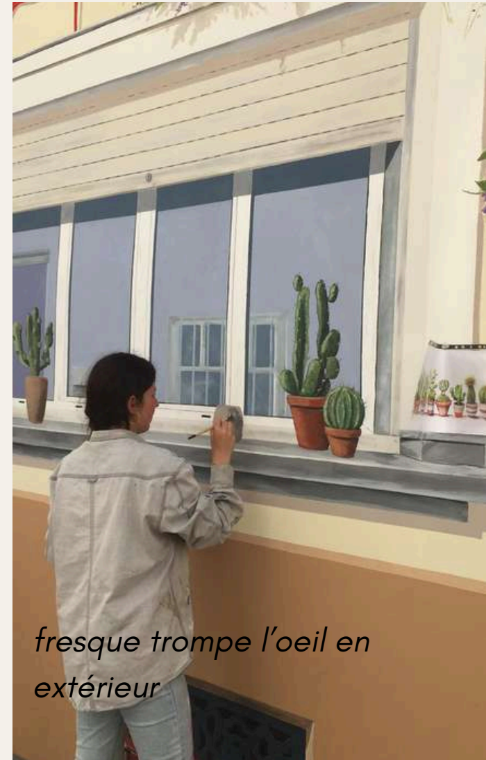
fresque trompe l'oeil en extérieur