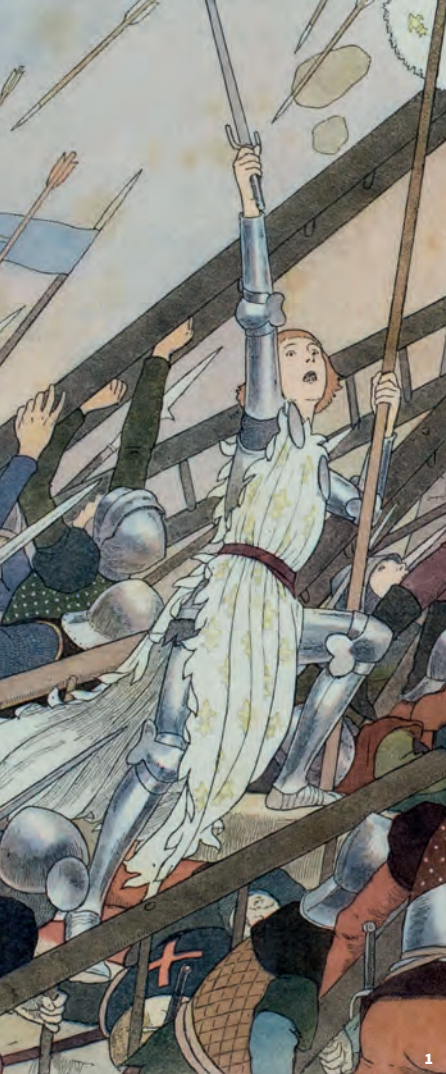
1. Jeanne d'Arc à l'assaut des Tourelles, aquarelle in Jeanne d'Arc, de Louis-Maurice Boutet-de-Monvel, Plon, Paris, 1896, album de luxe sur papier japon © Centre Jeanne d'Arc.